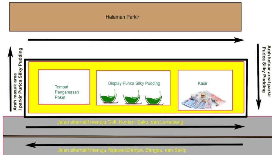
Gambar 5 Rencana Tata Letak Purica Silky pudding