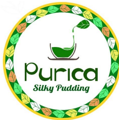
Gambar 1 Logo Purica Silky Pudding