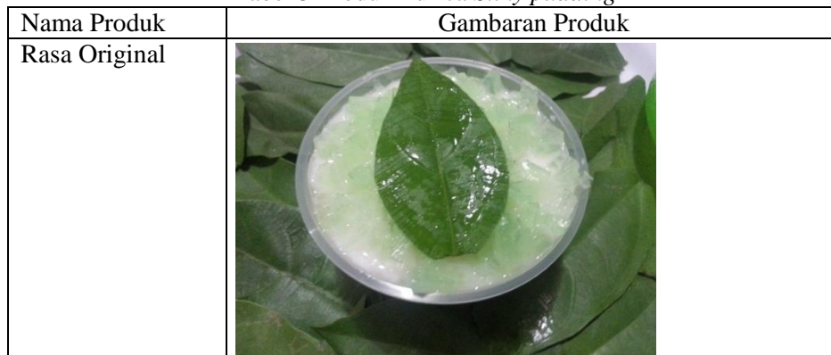
Tabel 5 Produk Purica Silky pudding