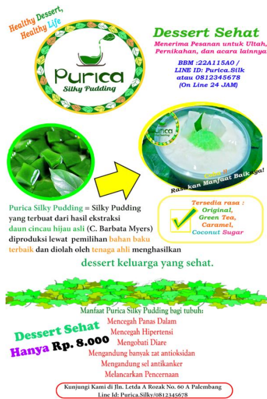
Gambar 2 Banner Purica Silky pudding