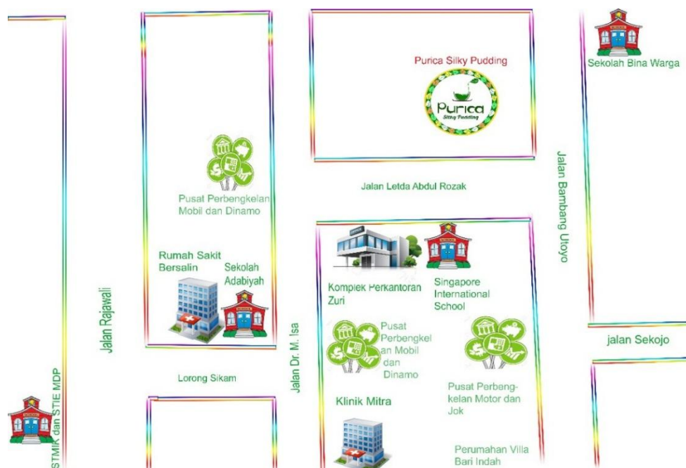
Gambar 4 Lokasi Usaha Purica Silky pudding

Purica Silky pudding akan berada di Jalan Letda A Rozak No. 60 A Palembang didukung dengan daerah yang dekat sekolah, hotel, dan jalan ini merupakan jalan alternatif menuju Jalan Bambang Utoyo, Jalan Sekojo, Jalan Lemabang, dan lainnya.